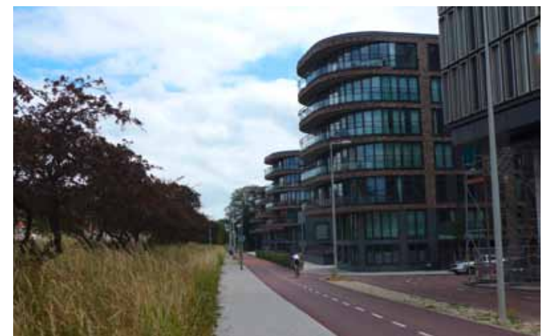
De opvallende ronde gevels van de Heelmeesters kan geen fietser ontgaan.

als 'de straten waar je verloren voorwerpen af kon halen'. Boerderij De Eenhoorn is hier het enige gebouw dat de eeuwen heeft doorstaan. Rond het Kraaipan schoolgebouw zijn altijd gezinswoningen geweest voor de vele kinderen, die hier naar school gingen. In het dubbele gebouw uit de dertiger jaren, waren eerst de openbare Louis Botha school en de Joodse Talmud Toraschool gehuisvest. In de oorlog nam Joodse school nummer 9 de plek in van