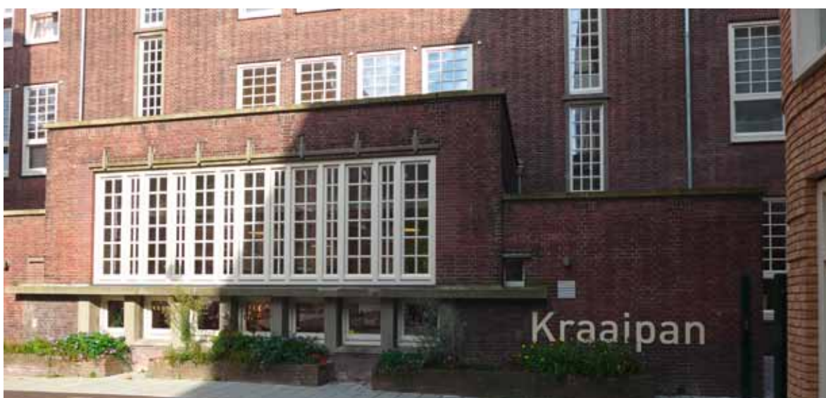
Gevel van het Kraaipangebouw, in Amsterdamse School stijl