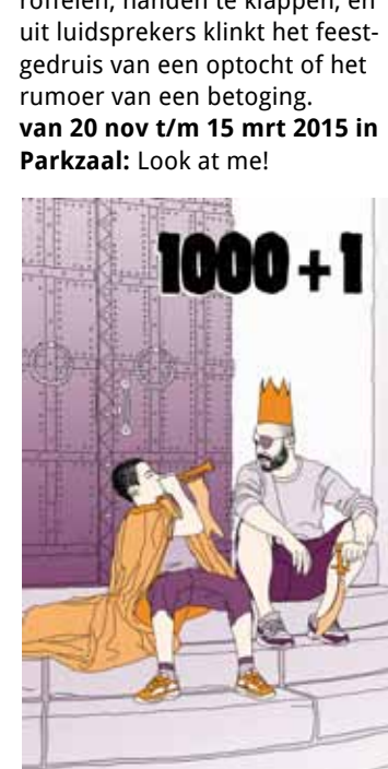
1000 + 1 tekening NedPho

van 20 nov t/m 15 mrt 2015 in Parkzaal: Look at me!