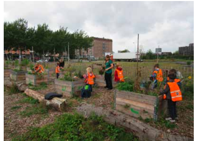
Kinderen van een BSO uit de buurt zijn hun bakken aan het verzorgen

zelf hebt gekweekt. Ik ben er trots op dat ik net mijn eigen aardappels heb geoogst! Er zijn twee rijen bakken voor de kinderopvang, de UK. Later zijn er ook bakken bijgezet voor verschillende BSO’s uit