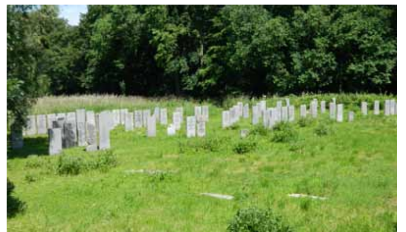
Een honderdtal graven is in ere hersteld.

De in 2002 overleden schrijver/journalist Boudewijn Büch schreef in Het Parool van 18 juni 1982 het volgende: 'Op een zomerse dag loop ik vanuit het eigenlijke Flevopark door een stenen poort Zeeburg op. Deze mooie poort is niet de oude ingang van het kerkhof. Het zogenaamde 'Hekkepoortje' stond tot 1898 aan de opgang van de brug die over de tegenwoordige Singelgracht ligt. Het poortje werd in 1938 herbouwd op de plaats waar het nu staat. De 'voormalige Israëlitische Begraafplaats Zeeburg' bestaat tegenwoordig uit drie delen waar openstaande smeedijzeren hekken naar toe leiden. Het is warm als ik door het hoge gras loop. Overal liggen mensen, soms op oude zerken, de zon te aanbidden. Er wordt zelden of nooit gemaaid op Zeeburg; het zou ook nauwelijks kunnen want de maaimachine of zeis zou stukslaan op de duizenden stenen en steenbrokken die overal in het gras – op moerassige plekken zelfs in het riet – liggen.' Dit artikel vormde de aan-