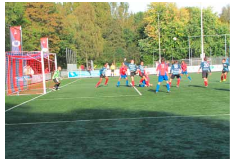
JOSWGM met rode shirts en blauwe broekjes en kousen in de aanval.

Ook vertelt hij over de begeleiding van de jeugdelftallen. Als een speler zich misdraagt krijgt hij een waarschuwing, bij de tweede keer worden ook de ouders uitgenodigd voor een gesprek en bij de derde keer wordt er afscheid genomen van de betrokken voetballer. Ook vindt hij het een goede zaak dat clubmensen elkaar met humor attenderen op bijvoorbeeld het feit dat er binnen ook een toilet is. Hij vindt het ook heel gezond dat de KNVB na de dood van de grensrechter van Buitenboys in 2012 initiatieven heeft genomen om het informele netwerk van amateurclubs te versterken. Als er nu een incident plaats vindt, dan is de drempel heel laag om een voorzitter van een andere club te bellen en eventuele