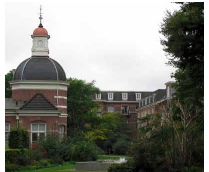
Blij met dit uitzicht

Van Wees: ‘Je kunt hier in de flat niet iedereen bereiken. Er wonen veel verschillende culturen daar krijg je moeilijk contact mee. Over vijf jaar vieren we ons 25-jarig bestaan en dan willen we alle bewoners van de 93 flats erbij betrekken. Dat is ons streven.’#