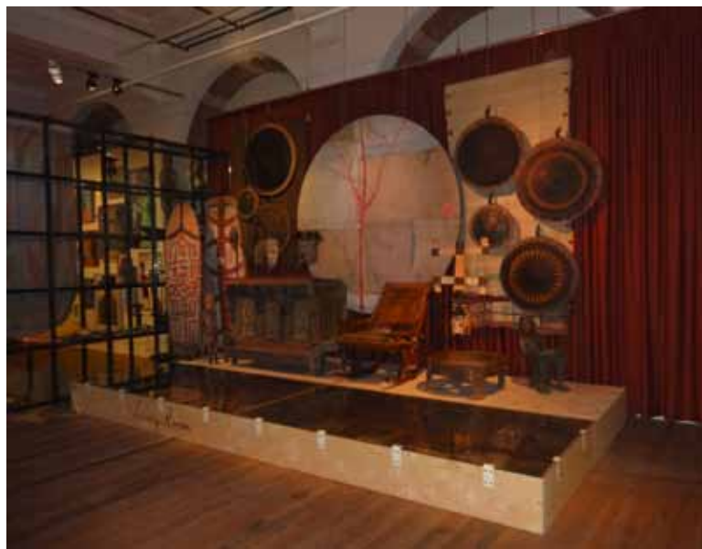
Eén van de negen kamers: Living Room

Daar waar de poster op straat nep en kitscherig oogt is de tentoonstelling zelf echt en beziel. Daar waar enige relativering in zijn toon, keuze en verhalen van Jasper Krabbé ten enenmale ontbreekt laat de tentoonstelling 'Soulmade' juist bescheidenheid, twijfel en diversiteit van interpretaties zien. T/m 25 januari is het werk van Jasper Krabbé te zien in het Tropenmuseum te midden van vele onbekende kunstwerken uit het verleden en uit verre landen.