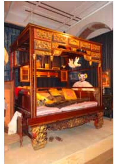
Een deel van de Bed Room

Een maand later loop ik op een zonnige vrijdagmiddag nogmaals door de negen 'kamers'. Een enkele passant tref ik, en een enkele suppoost: veel bekijks lijkt de tentoonstelling (nog) niet te krijgen. Net als de eerste keer ben ik onder de indruk van de sfeer die is gecreëerd. En net als de eerste keer wordt mijn aandacht niet